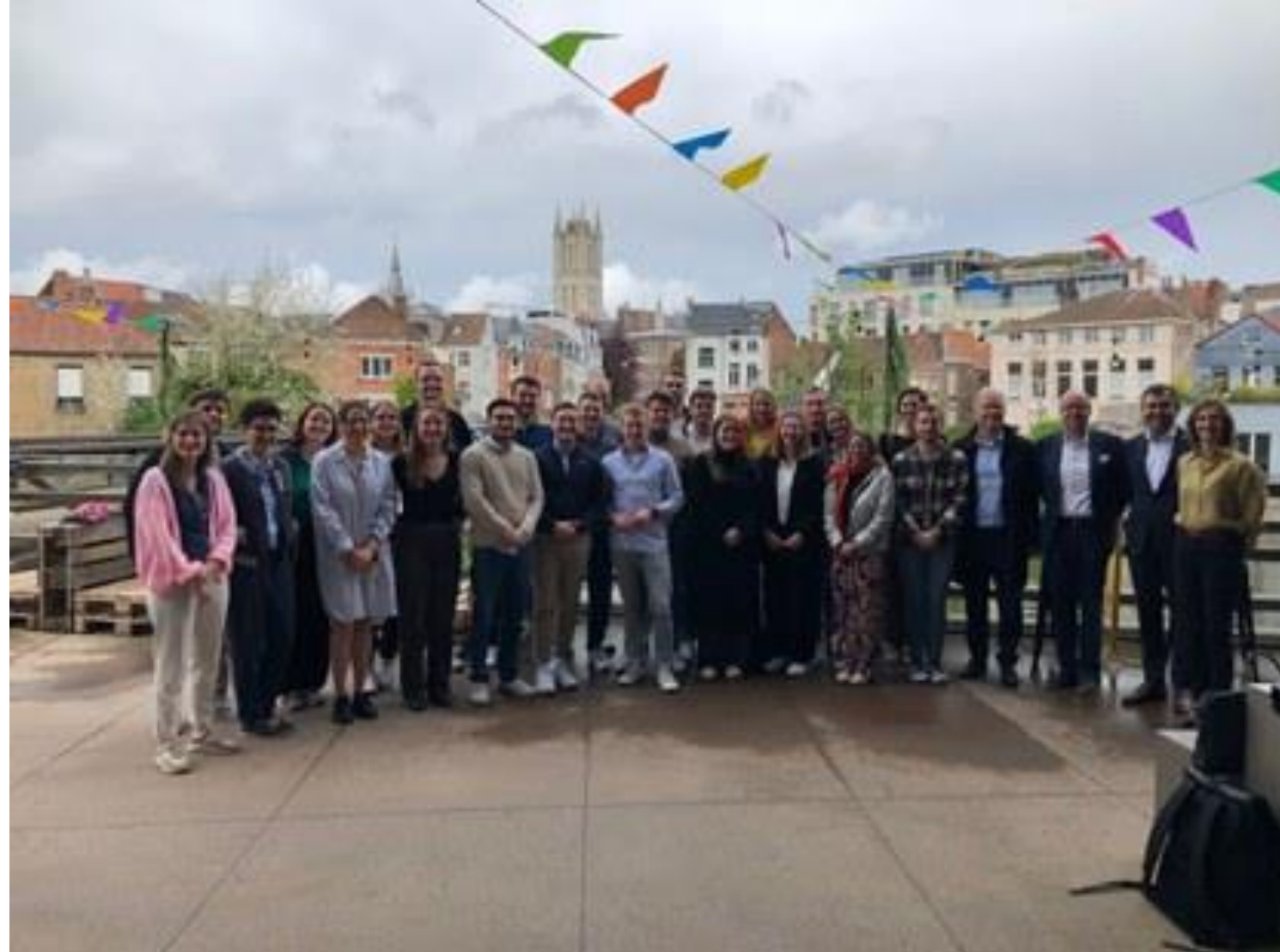
International case Göttingen