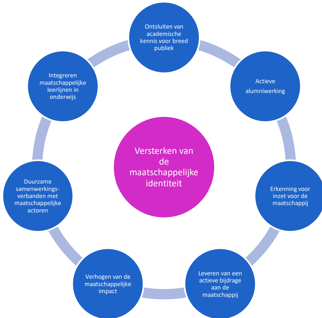
Figuur 1: De 7 strategische doelstellingen Maatschappelijke Outreach van de faculteit

Hierna zullen de diverse strategische doelstellingen verder toegelicht worden en zal er per strategische doelstelling ook een verdere operationalisering gebeuren die weergegeven wordt in operationele doelstellingen en concrete acties.