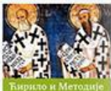
Ћирило и Методије

Веома давно, средином деветог века, византијски цар је желео да браћа Ћирило и Методије направе писмо за Словене, народ који је живео на северу Византијског царства. Иако су били Грци, Ћирило и Методије су знали словенски језик. Зато су знали како да направе прво словенско писмо. Користили су грчки алфа-