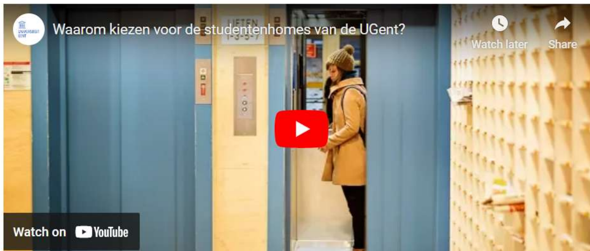
Een virtuele rondleiding in de home